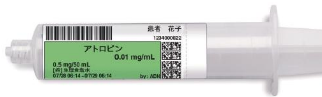
シリンジポンプ・スマート輸液ポンプ用サイズ 80 mm×30 mm