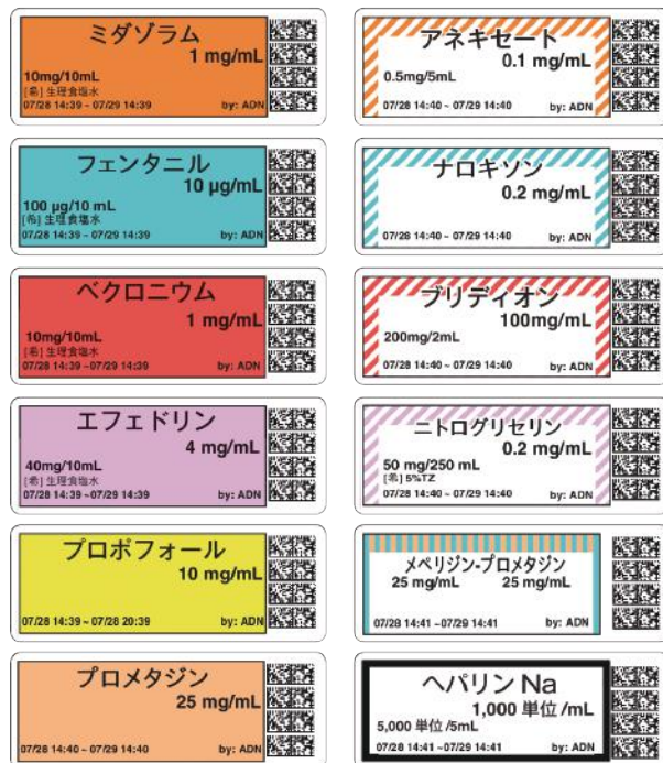
標準サイズ 60 mm×22 mm

医療カンパニー 高度医療部 〒105-0014 東京都港区芝2丁目13番4号住友不動産芝ビル4号館 Tel 03-5439-9582 Fax 03-3453-2396 https://www.awi.co.jp/business/medical/